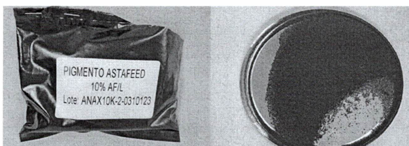
Imagen de la mercancía

La mercancía se presenta en envase no original, bolsa plástica color negro rotulada como, “Pigmento AstaFeed 10% AF/L”, conteniendo en el interior un producto sólido en micro gránulos, color burdeo a marrón de granulometría homogénea.