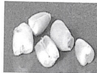
Granos de trigo con corte transversal

Que, de acuerdo a información proporcionada por los interesados, el producto objeto de estudio se describe como "Trigo de especie blando (especie Triticum Aestivum ), harinero para la molienda, plantado en Primavera, en las praderas de Canadá."