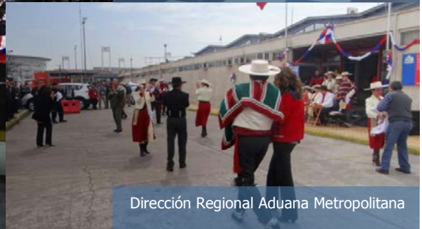
Dirección Regional Aduana Metropolitana