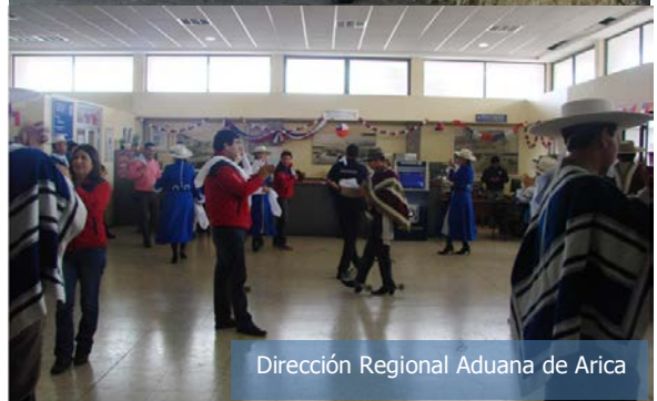
Dirección Regional Aduana de Arica