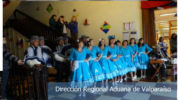
Dirección Regional Aduana de Valparaíso