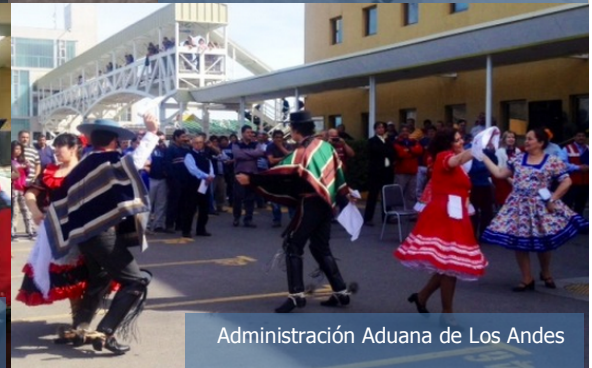
Administración Aduana de Los Andes