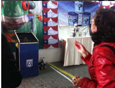
Administración Aduana de Osorno