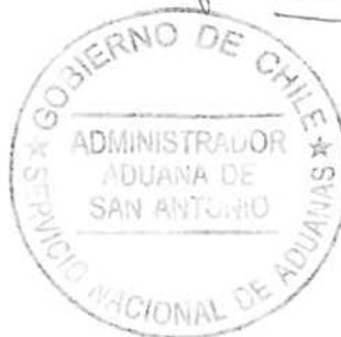
RAMON DIAZ MORALES JUEZ(S)

SMR/LQM/lqm Cc: Interesado U. controv. (2) Archivo